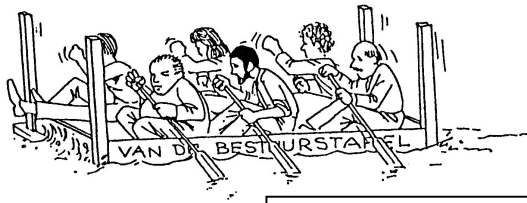
Illustratie uit Logboek1993

Het is voorjaar. Voor de één begint dan het vaarseizoen, terwijl het voor de ander het hele jaar door vaartijd is.