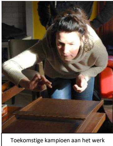
Toekomstige kampioen aan het werk

Ging de categorie Jeugd+ in de pauzestand, dan kwam de categorie Jeugd aan de beurt. Ook daar werd serieus gespeeld. Al lieten anderen zich er niet door afleiden en speelden zij ondertussen rustig een serieus potje schaak.