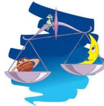
WEEGSCHAAL 24 SEPTEMBER TOT 22 OKTOBER