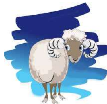
RAM 21-3 t/m 20-4