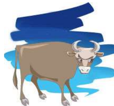
STIER 21-4 t/m 20-5